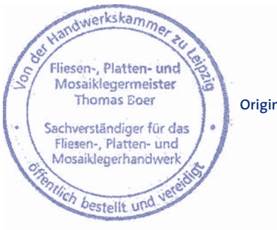
Originalgröße: Durchmesser 43 mm

Der Sachverständige hat ausschließlich den von der Bestellungskörperschaft ausgehändigten Rundstempel zu verwenden und dessen Verlust unverzüglich anzuzeigen (s. auch 13.4 dieser Richtlinien).